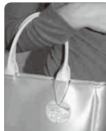
マタニティマーク入りキーホルダーは、妊産婦の証し。未来のお母さんと赤ちゃんをみんなで守りましょう