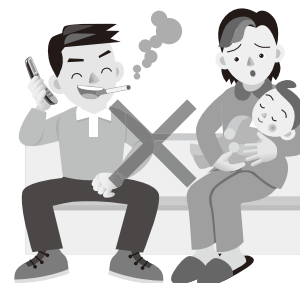
たばこの煙は、母子の健康を害します

妊産婦さんや子育て期間中のお母さんを見かけたら、みんなでやさしく応援していきましょう。