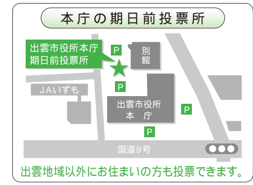
出雲地域以外にお住まいの方も投票できます。

【佐田地域】 佐田支所1階ロビー 【多伎地域】 多伎支所2階会議室 【湖陵地域】 湖陵コミュニティセンター1階研修室(湖陵支所隣) 期間 / 3月31日～4月7日 (土・日曜を含む)