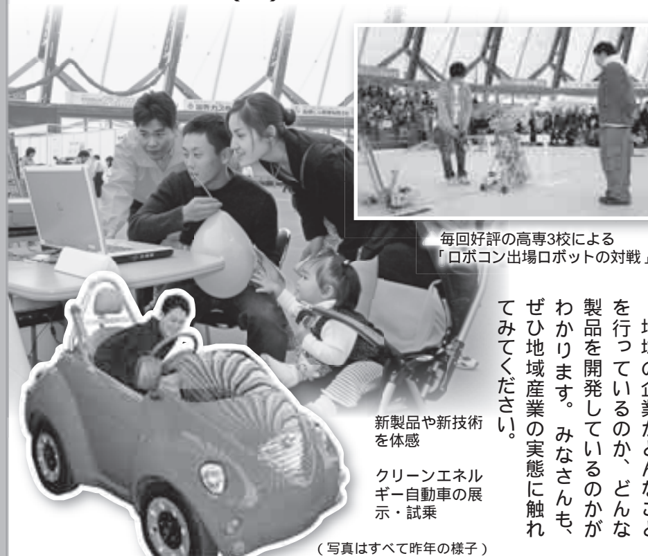
毎回好評の高専3校による「ロボコン出場ロボットの対戦」

とき 11月11日(土)10:00~17:00 (11日10:00~10:20 オープニングセレモニー) 12日(日)10:00~16:00 ところ 出雲ドーム(矢野町)