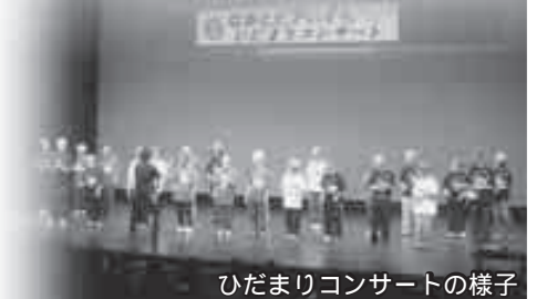
ひだまりコンサートの様子

また、地域の人々とふれあう機会を持つことで、障害のある方に対する理解と関心を高めてもらうことも目的としています。心のこもった発表を皆さんもぜひ見に来てください。