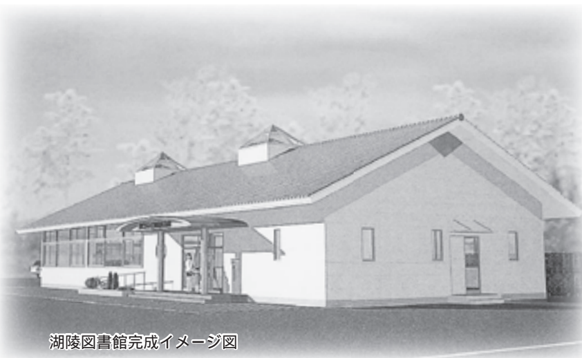
湖陵図書館完成イメージ図

市では、現在、湖陵支所西側に湖陵図書館の整備を進めています。開館は来年3月末の予定で、整備にあたっては『湖陵図書館検討委員会』を設置し、検討してきました。今回は、湖陵図書館整備の概要についてお知らせします。