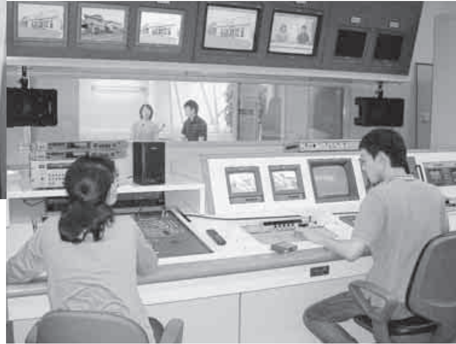
佐田地域においてケーブルテレビの整備を行い、地上デジタル放送への対応と情報格差の是正を図ります

6月定例会市議会が、6月13日から6月28日までの会期で開催され、平成18年度一般会計第1回補正予算など、議案が原案どおり可決、承認されました。