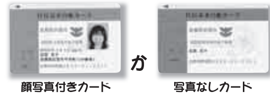
顔写真付きカード