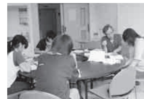
勉強会では、通信教育のレポートをしたり、自由に学習したりします