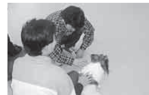
アニマルヒーリングでは犬と触れ合います。動物には、一緒にいるだけで、心を和ませ癒す効果があると言われています