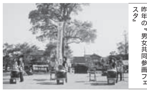
昨年の「男女共同参画フェスタ」

6月3日(土)、6月4日(日)両日 作品展示(木目込、生花、水墨画、書道、紙粘土、絵手紙、ガラスアートなど)、喫茶コーナー 6月3日(土)のみ 舞台発表(ダンス、コーラス、詩吟など)、バザー おたずね/ふれんどリーの会(事務局:平田ふれんどリーハウス TEL 63-3728)