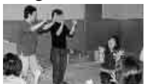
手遊びをまじえて「わらべうた」を楽しく紹介

参加者募集 「わらべうたであそぶかあー?」 親子で大いに笑い、体を使って遊ばしよ。