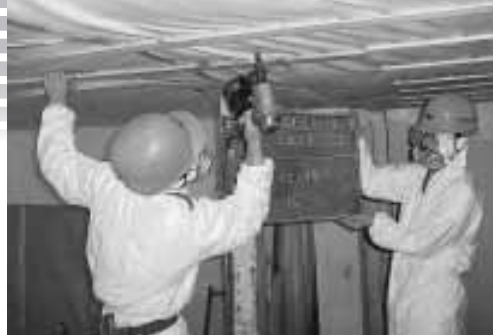
児童の安全確保のため、一部の施設では分析結果を待たずに飛散防止のための暫定工事を行いました(写真は乙立小学校)