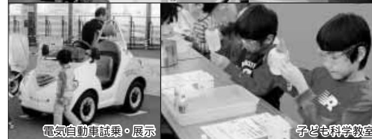
電気自動車試乗・展示

11月12日、13日の2日間、「21世紀出雲産業見本市2005」を出雲ドームで開催。地域の企業が開発した技術や製品、国内先端技術の体験のほか、産学連携による取り組みを紹介し、新エネルギーやIT、健康・医療・福祉・環境・リサイクルなど、さまざまな分野から115の企業・団体・学校がドームいっぱい魅力あふれる展示ブースを設けます。