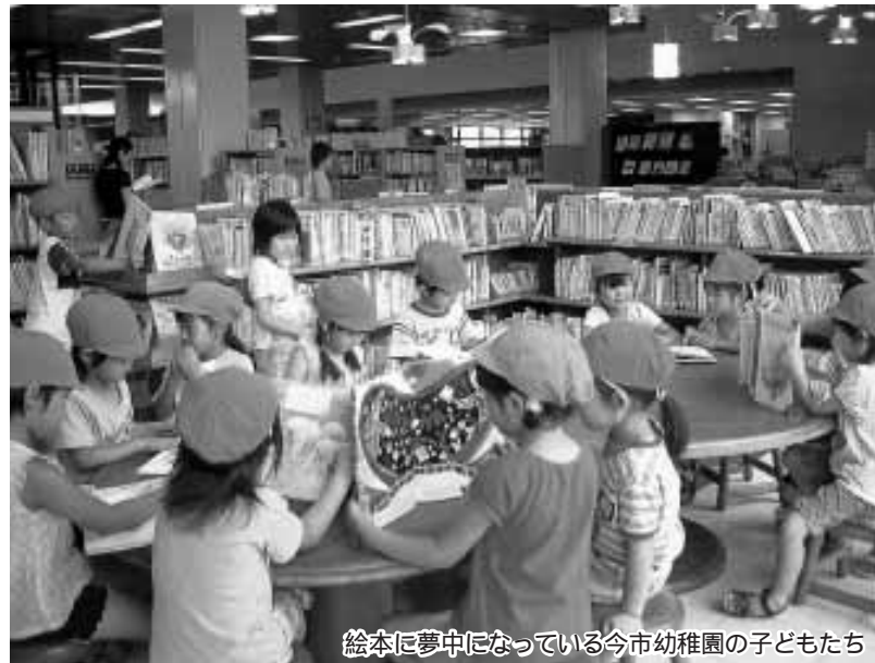
絵本に夢中になっている今市幼稚園の子どもたち

昭和22年から始まった「読書週間」。文化の日を はさんだ2週間、読書を推進する行事が全国各地 で行われます。 今回は、市内の図書館で行われる読書週間行事 をお知らせします。