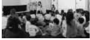
楽しい催しが盛りだくさん。どんなお話が飛び出すかな

大社図書館 「おはなし玉手箱」 参加者募集 でんでんむしポランティアによる楽しいお話の世界が繰り広げられます。 とき 10月22日 14時~15時 ところ 大社文化プレイス(大社町) 対象 幼児・小学生とその保護者 内容 人形劇「まんまるばん」、絵本の読み聞かせ、紙芝居、手遊びほか おたずね 大社図書館