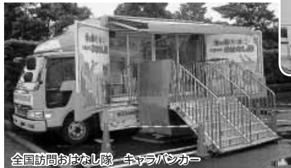
全国訪問おはなし隊 キャラバンカー