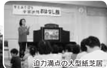
迫力満点の大型紙芝居