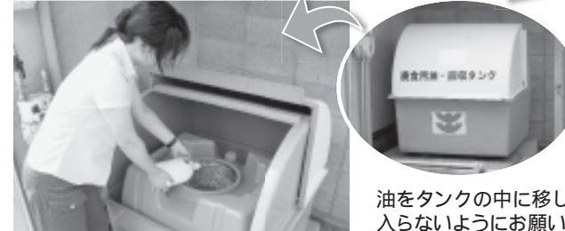
油をタンクの中に移します。揚げかすや水分が入らないようにお願いします