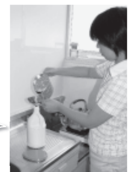
油を購入時の容器やペットボトルなどに入れます この中に回収タンクが入っています

回収した天ぷら油(植物油に限ります)は、バイオディーゼル燃料に生まれ変わります。平田地域を走る生活バスのうち、3台はこの燃料で走っています。 【回収場所】本庁および各支所 【回収方法】設置してある回収タンクに移してください(写真参照) 【回収日】月~金曜8:30~17:00(祝日など閉庁日を除く) 飲食店などで使用した植物油も持ち込み可