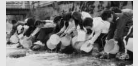
「大きくなって、帰ってきてね」。児童が300匹あまりのサケの稚魚を放流しました

3~9匹のサケが戻ってくるようになりました。この日放した稚魚は、順調にいけば4年後にサケとなって戻ってきます。