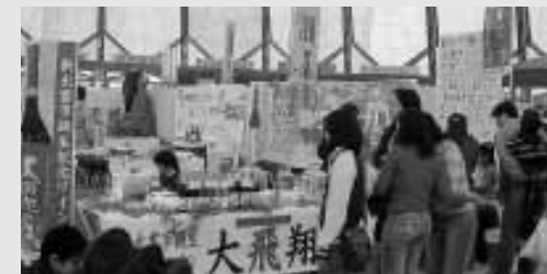
たくさんの商品の中から、思い思いの品を選ぶ来場者

新「出雲市」の誕生を記念して、出雲圏域のおいしいものを一堂に集めた「出雲ブランド“食の祭典”」が3月26・27日の2日間行われました。会場となった出雲ドームには、そば、お茶、ワカメなど地元の特産品を販売するブースや、その場で味わえるコーナーなどが設けられ、2日間で約18,500人の来場者がありました。