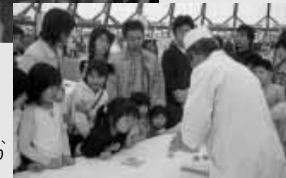
職人さんの鮮やかな手さばきから、次々に色とりどりの和菓子が作り出されます

また、和菓子教室やそば打ち体験もあり、出雲の食文化に触れることのできるイベントとなりました。