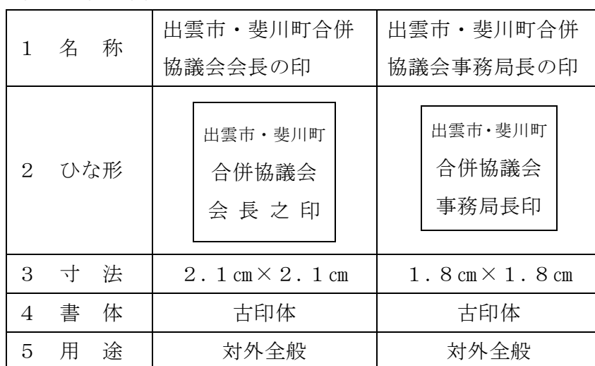
別表第 2 (第 8 条関係)