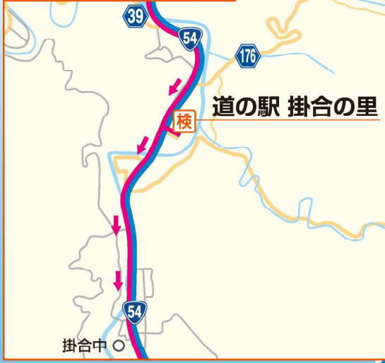
検査場所周辺地図②