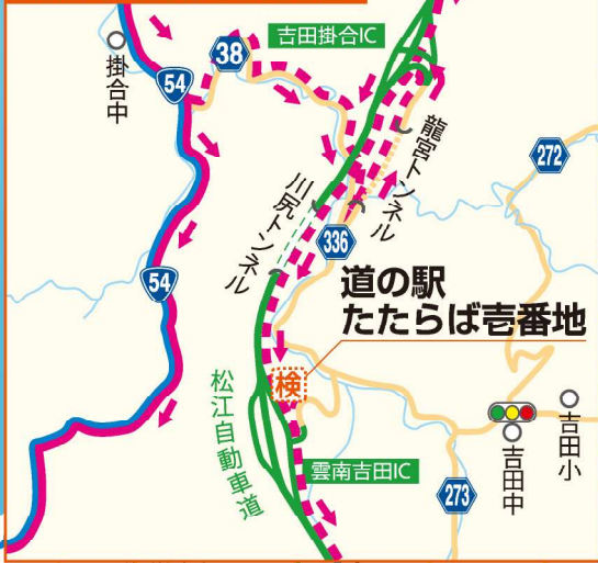
検査場所周辺地図②