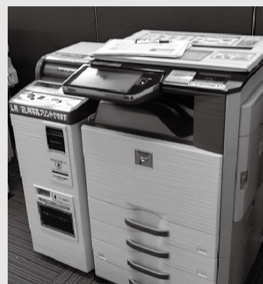
マルチコピー機(イメージ)