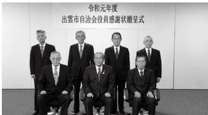
感謝状を贈呈されたみなさん

今年度は、自治協会展長や区長を通算5年以上務められた方3名、単位自治会（町内会）長を連続10年以上務められた方4名のあわせて7名に、感謝状を贈りました。