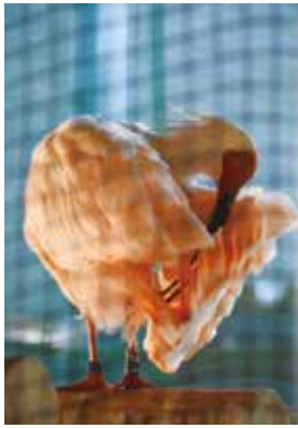
夕陽で朱鷺色も鮮やかに

今年7月から始まったトキの一般公開は、10月10日には、入場者1万人を達成しました。市内外から多くの人に見に来ていただいております。