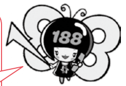
消費者庁 消費者ホットライン188 イメージキャラクター「いややん」