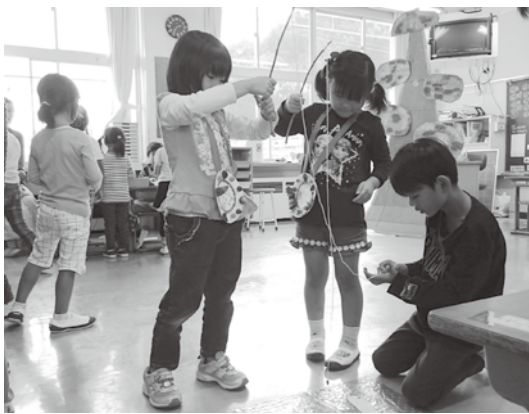
窪田小学校：「あきまつり」の様子

交流の日では、小学校によって違いはありますが、子どもに小学校の児童や他の保育所・幼稚園等の友だちと一緒に遊びや学習を体験しても