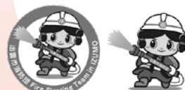
採用作品別パターン