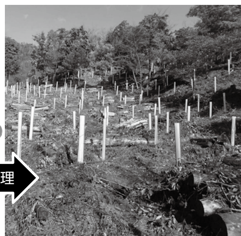
【植栽、食害防止筒設置後】