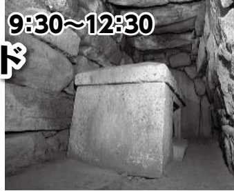
「今市大念寺古墳」日本最大の冢形石棺