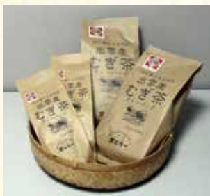
10g×12袋入と10g×30袋入の2種類を展開しています。