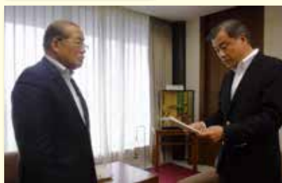
長岡市長（左）へ川本委員長（右）から最優秀提案者選定の答申書が提出されました。