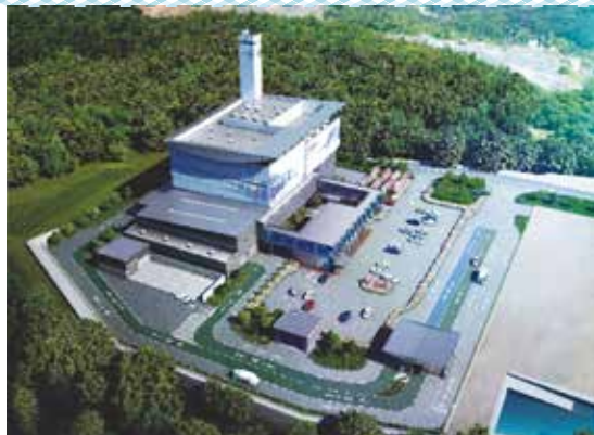
周辺環境と調和した先進的な景観デザイン