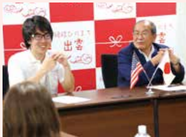
海外からのゲストの通訳にも活躍しました

同い年以外の人とあまり話したことがなかったのに、子どもから高齢者まで交流機会が多くありました。日本人でもあまり体験しない田植えや餅つき、そば打ちを何回もさせてもらいました。この国でう