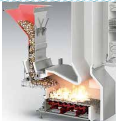
高性能のストーカ式焼却炉