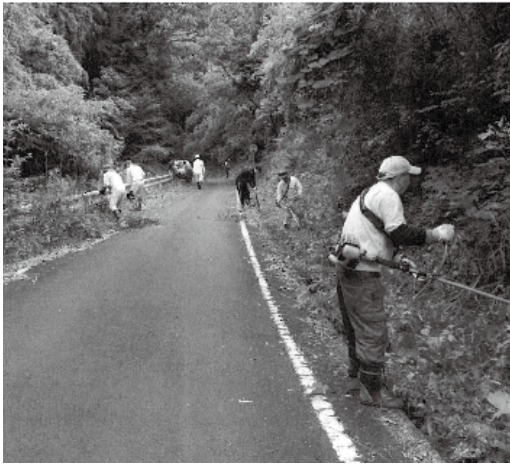
地域の皆さんによる道路ふれあい愛護活動 (朝山地区)