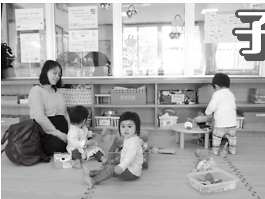
子どもも保護者もリフレッシュできる場所です。(いずも子育て支援センターの様子)

平成30年7月 島根県立大学出雲キャンパスに 子育て支援センター開所予定! (詳しい内容が決まりましたらお知らせします)