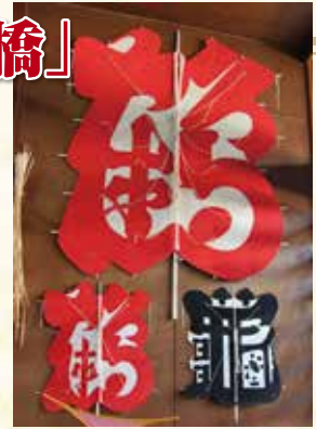
店舗入り口の祝風。お祝いの贈り物や結婚式の引出物としても依頼があります。

黒い凧「亀」は、上側に大黒様の打ち出の小づちや袋、左下に福が多く来るように「多」の字、右下に米俵を表しており、ここにしかない縁起物です。