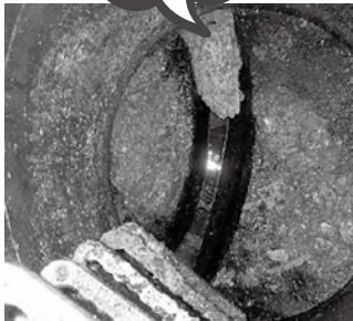
油で詰まった下水道本管 (マンホール内部を撮影)