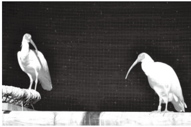
※新規B Rペア(左が新しく来たオス)

ていない血統ですので、遺伝的多様性のためにも何とか1羽でも育ててほしいと思います。