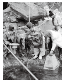
今年の和布刈神事でわかめの初刈をする神職