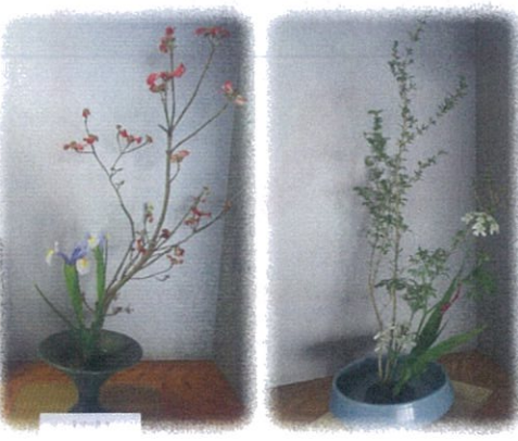
《生花教室の皆様の作品》 いつもありがとうございます

新センター長を中心に、職員一丸となって創意工夫をこらし「まちづくりの拠点」を目指して参りますので、引き続きご支援ご協力をいただきますようお願い申しあげ、新年度にあたりご挨拶いたします。