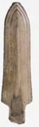
原山遺跡の磨製石剣(長さ約17cm)

また、原山遺跡では他地域との交流を示す、剣の形をした磨製石剣や、粘土帯土器(口の外周に粘土の紐を貼り付けた甕形土器)も出土しています(弥生時代前期末から中期頃か)。両者の材質や形などの特徴から朝鮮半島のものを模倣し、九州北部で作られたものと考えられます。これらが原山遺跡に持ち込まれたのです。