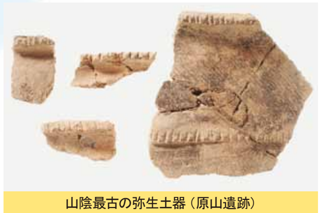
山陰最古の弥生土器(原山遺跡)

原山遺跡から発見された遺物で注目されるのは、「出雲原山式」と呼ばれる出雲で作られた弥生時代前期の土器です。これらは山陰最古の弥生土器で、九州北部のものに形や文様がよく似ています。土器には稲籾の圧痕が確認できるので、出雲で米づくりがおこなわれていたことが推察できます。これらの山陰最古の弥生土器は、米づくりの文化が山陰に伝わったプロセスを示す貴重な資料です。