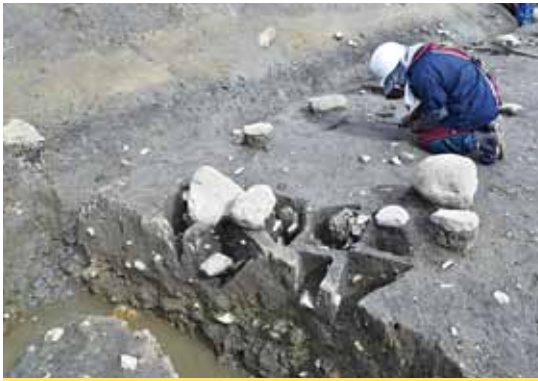
土器を含んだ土坑(左)と配石土坑(右)

今後は出土した遺物を検討して「縄文時代の出雲」に生きた人々の様子をさらに明らかにしていきます。 (幡中光輔)