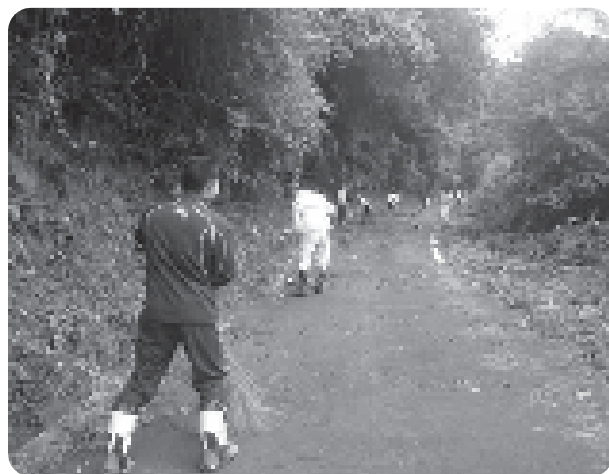
集落道の草刈りと清掃に汗を流す集落応援隊の皆さん