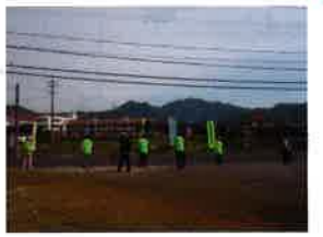
上津小バス停付近