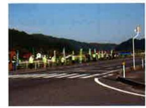
鳥屋川バス停付近

春の全国交通安全運動にあわせて5月11日鳥屋川バス停、18日上津小バス停付近で立哨活動を行いました。たくさんの交対協役員の方が集まってくださり、通行される車や登校する子ども達に今一度交通安全に気を付けてもらう良いきっかけとなりました。