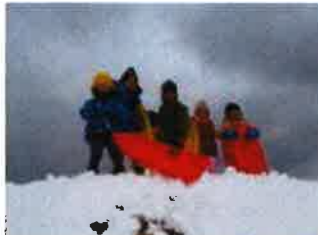
水辺公園の築山で、そり滑りに挑戦！