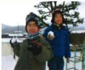
年長きく組 雪合戦をしたよ！