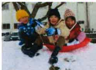
年中さくら組 そり滑り楽しいよ！