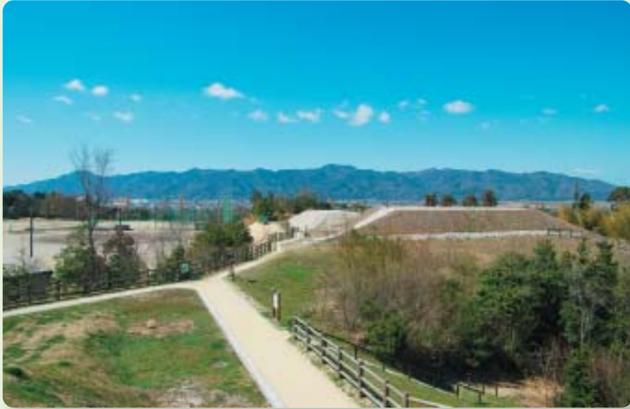
国指定 西谷墳墓群