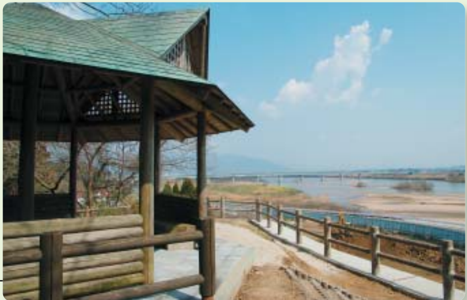
来原岩樋公園から斐伊川を望む