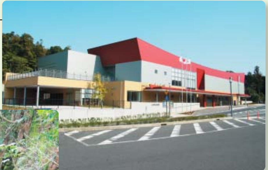
出雲弥生の森博物館