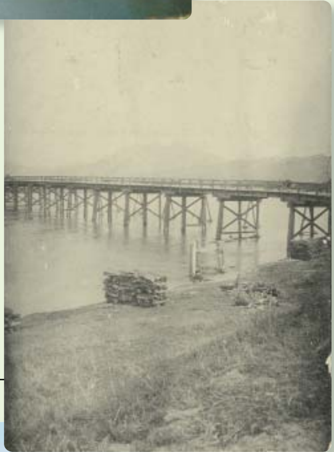
神立橋(昭和初期の木橋)