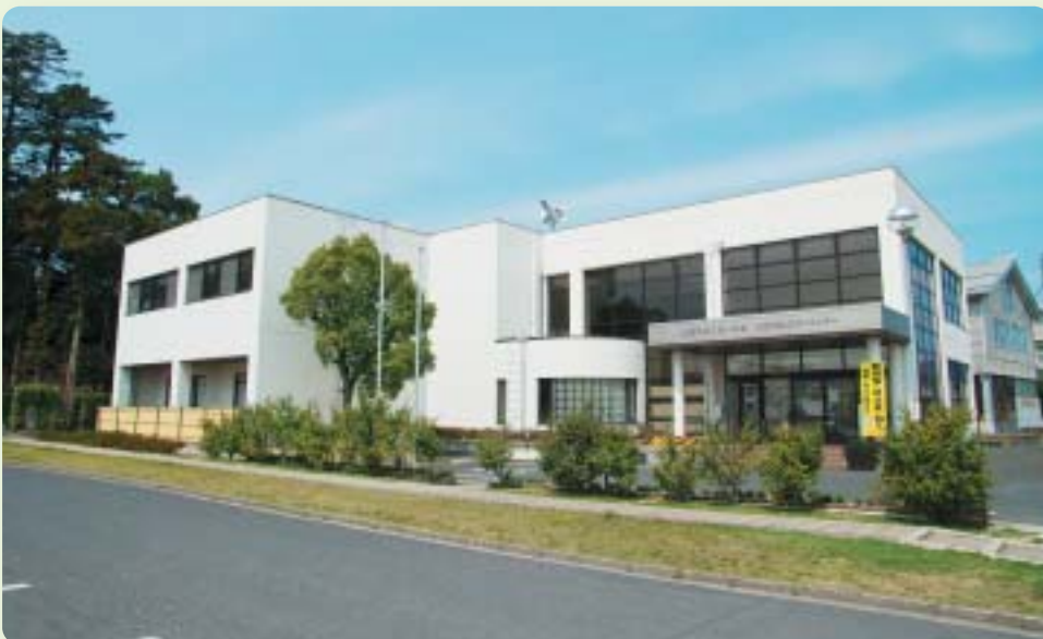
大津コミュニティセンター