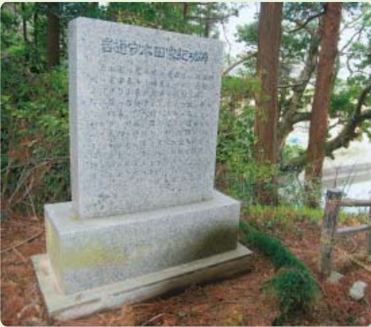
岩樋守本田家紀功碑