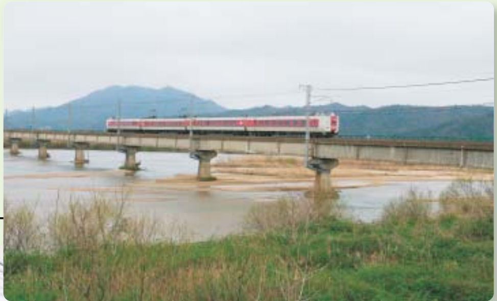
J R山陰線 斐伊川鉄橋