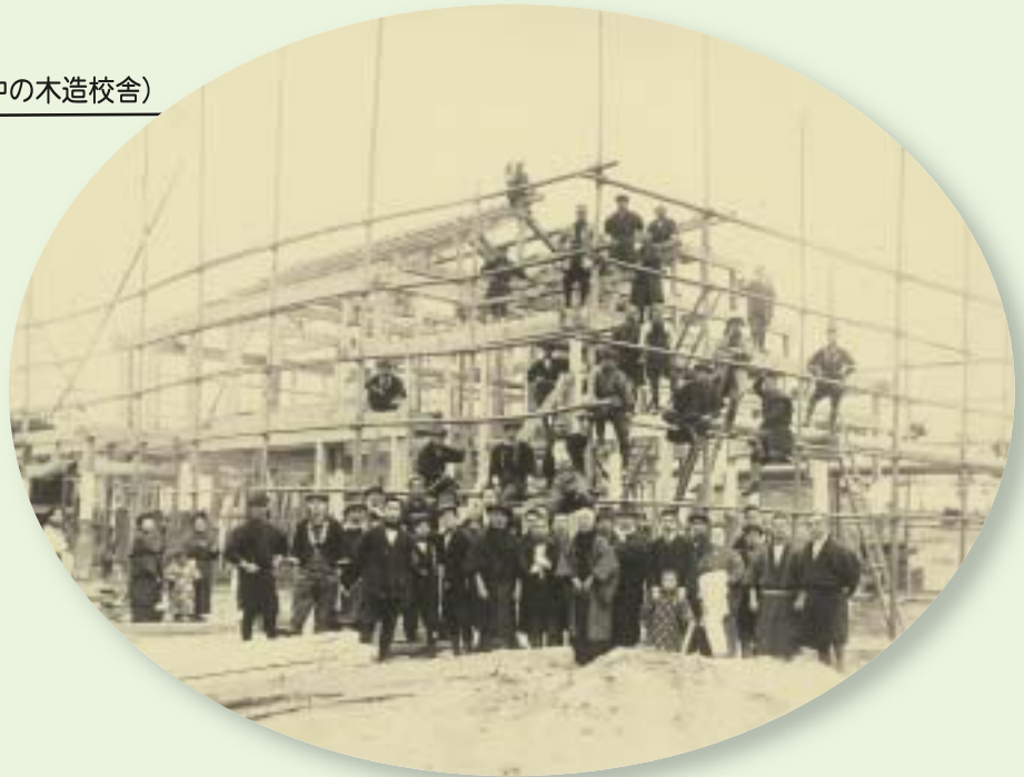
大津小学校（昭和2年建設中の木造校舎）