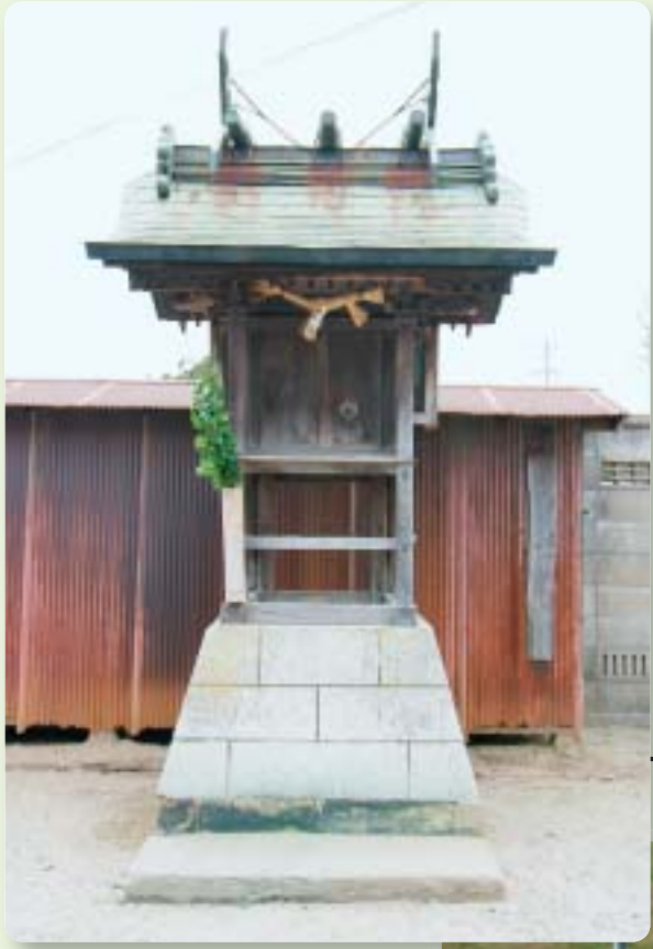
にぎみたま 和魂神社 (水の守り神)