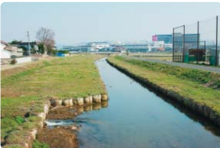
新内藤川流(暫定改修箇所)