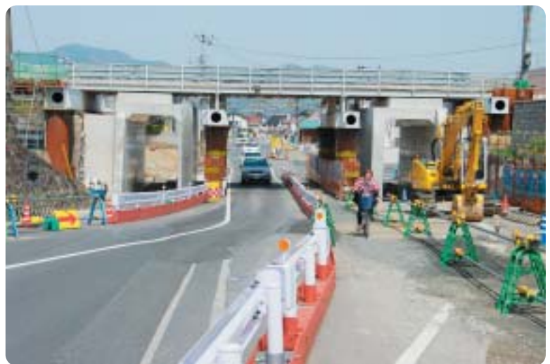
市道大津中央一の谷線(JR高架下拡幅工事)

一方、市道を接続する県道出雲平田線は、大津小学校へのアクセス道路であり、特に国道9号出雲バイパス以北の県道斐川出雲大社線までの早期拡幅が必要である。