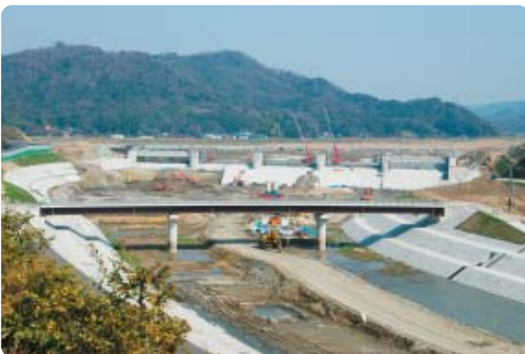
斐伊川放水路分流堰

斐伊川水系の治水対策をまとめた「斐伊川水系河川整備計画」が、平成22年(2010)に島