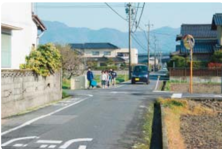
市道29号線(国道9号バイパス～大津小学校)

また、道路照明灯(防犯灯を含む)を暗所に設置し、一層の防犯対策の強化を図り、安心・安全なまちづくりを目指すべきである。