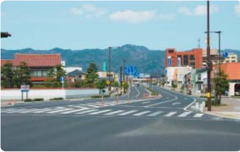
県道多伎江南出雲線

第4に、県道多伎江南出雲線は県の都市計画事業として、市道川跡日下線は市の土地区画整理事業として4車線の道路が整備された。