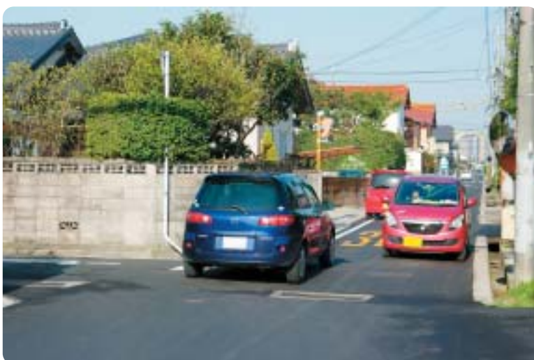
市道12号線(市道日下川跡線～県道出雲平田線)