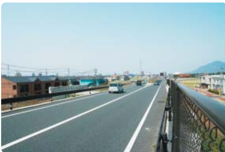
国道9号出雲バイパス(平成7年開通)

都市計画道路天神一の谷線は、雲南市加茂岩倉遺跡、斐川町荒神谷遺跡、大津町弥生の森・西谷墳墓群、塩冶町築山古墳を結ぶ史跡公園整備計画の一環道路であり、すでに出雲市議会において審議され、平成15年(2003)2月に採択された。一部未着工区間〔約1.0km〕があるため、早期の完成が望