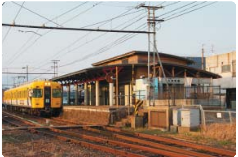
一畑電鉄大津町駅