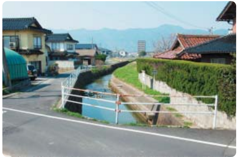
新内藤川流入口付近