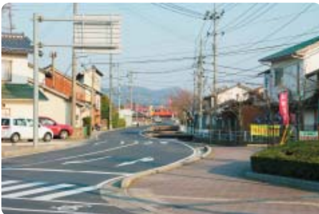
市道大曲来原線(起点側)