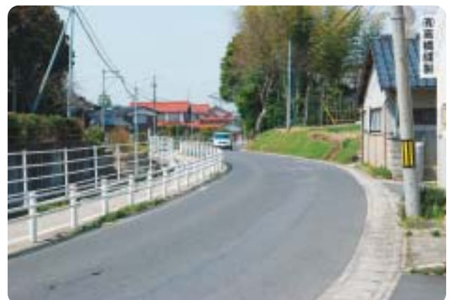
市道大曲来原線(終点側)