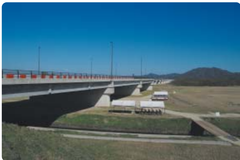
国道9号出雲バイパス(からさで大橋)