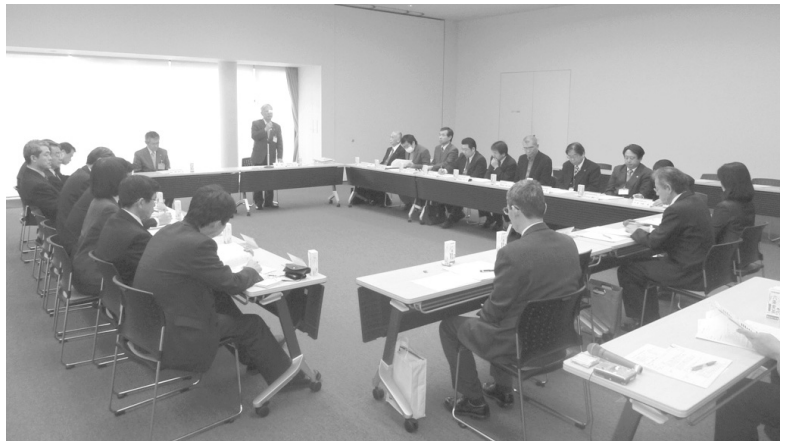
1月28日 出雲市子ども・若者支援協議会を設立

市では、この推進法の施行に伴い、子ども・若者育成支援に係る関係機関・団体が連携をとりあい、効果的かつ円滑な支援をおこなっていくために、1月28日、「出雲市子ども・若者支援協議会」を設置しました。この協議会を中心に、関係機関・団体、地域が連携しあつて、困難を抱える子ども・若者への支援を進めていきます。