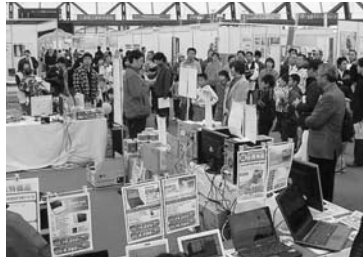
昨年の会場の様子

企業などの技術・製品を一堂に集め、展示・販売を通じて広く情報発信する産業見本市を開催します。今年は食品関連業種も募集します。たくさんの企業・団体の出展をお待ちしています。