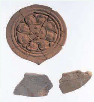
かざ 寺の屋根を飾った瓦 かんとじけいたいはいじあと （神門寺境内廃寺跡）

6世紀に日本に伝わった仏教は、奈良時代には出雲にも広まりました。寺院の屋根に葺かれた瓦や、儀式に使われた仏具などが、市内の遺跡からも出土しています。また、仏教の風習にならい火葬をおこなった人びともいたようです。