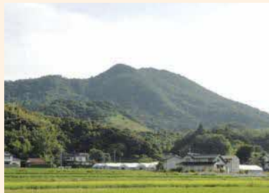
かなびやま 「神名火山」(神が宿る山) ぶつきょうざん 仏経山