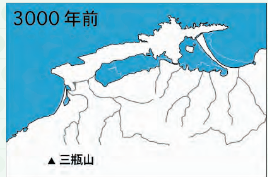
出雲平野の成り立ち