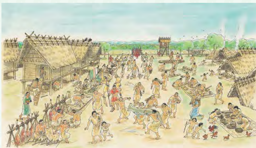
出雲平野のムラのイメージ