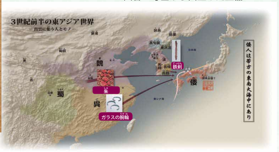
出雲に集まるモノ