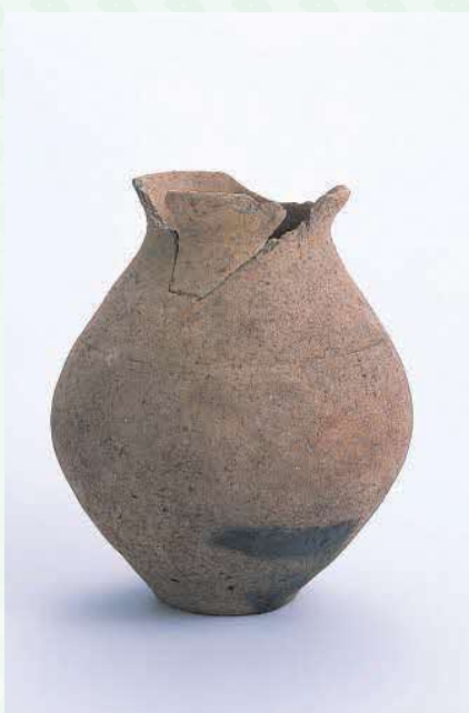
米づくりが始まった ころの壺 (矢谷遺跡)