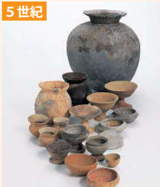
かた すえき 灰色の硬い須恵器が いはら 使われ始める（井原遺跡）