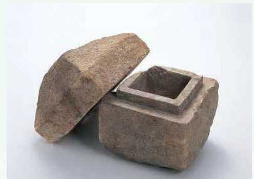
火葬した骨を入れた石の容器 あさやまこぼ （朝山古墓）