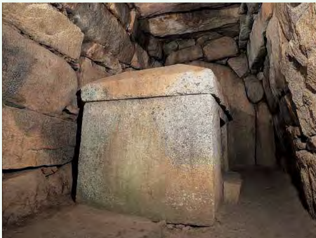
今市大念寺古墳（6世紀）の石棺 （日本一大きな家形石棺）