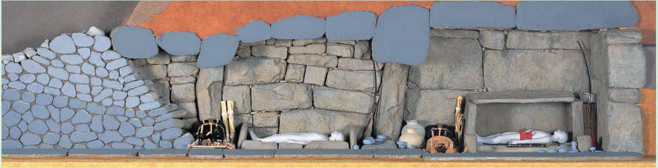
くにどみなかむら 国富中村古墳（6世紀）の埋葬のようす まいそう （盗掘されていない古墳は珍しい）