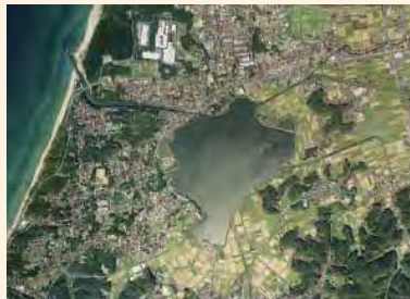
かんのみずうみ じんざいこ 「神門水海」 神西湖