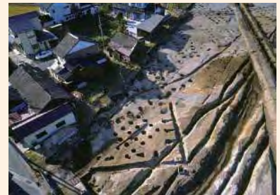
かんどくうけ 「神門郡家」(当時の役所) こしほんごう 古志本郷遺跡