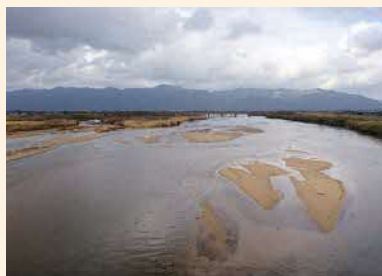
いずもおおかわ ひいかわ 「出雲大川」 斐伊川