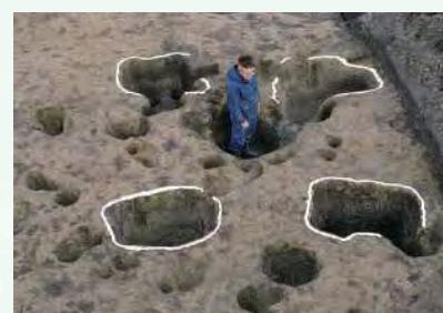
大きな柱あと (物見やぐらか、しもこし遺跡)