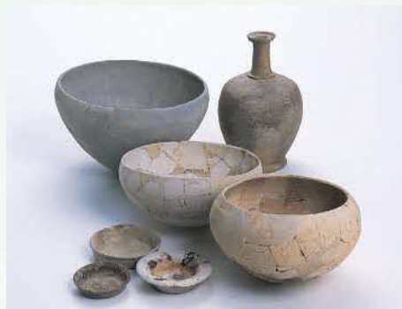
ぎしき 仏教の儀式に使われた土器 つぎやま （築山遺跡ほか）