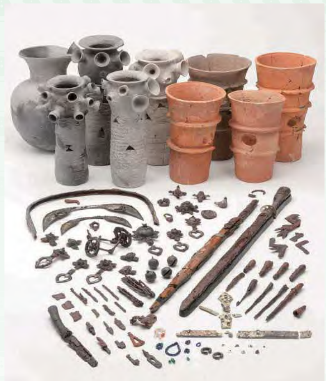
かみえんやつまやま 上塩冶築山古墳（6世紀）の出土品 （重要文化財）