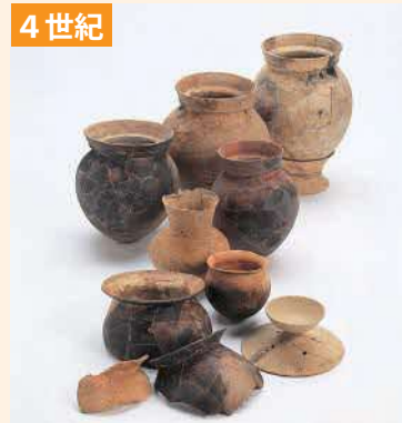
はじき 赤焼きの土師器 しもごし （下古志遺跡）