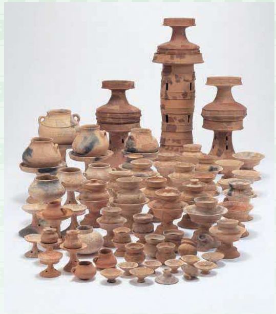
西谷3号墓から出土した土器