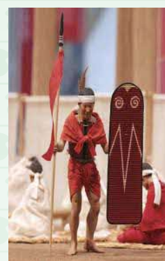
たて 楯を持つ兵士（復元品㊦）と 楯の一部（海上遺跡㊦）