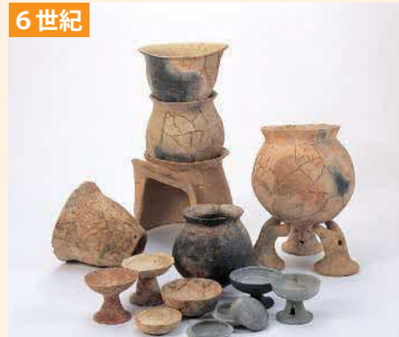
む カマドと蒸し器など おく 右奥の支え道具は出雲独特 （おわし遺跡・古志遺跡）