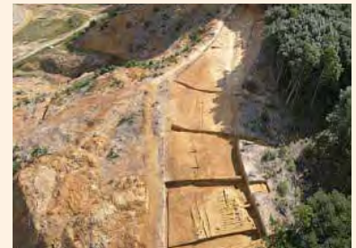
まにしのみち 「正西道」(古代の国道) いずものくにさんいんどうあと 出雲国山陰道跡