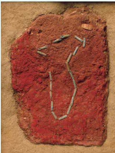
すいぎんしゆ 水銀朱とガラスの ネックレス