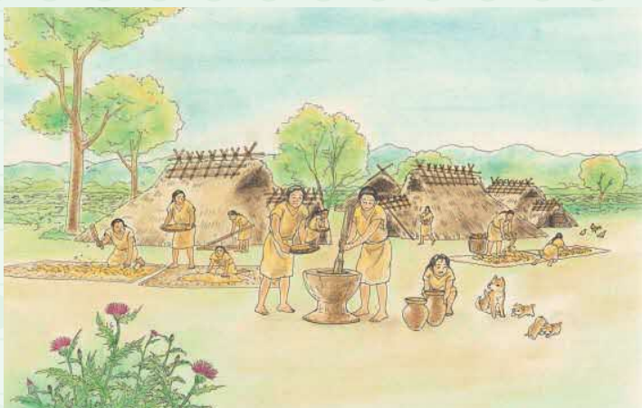
収穫した米をあつかうようす

これらのムラからは、実際に米づくりに使われた道具のほか、弥生時代から使用が始まった青銅器や鉄器も見つかっています。