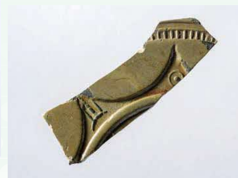
青銅の鏡の破片 (白枝荒神遺跡)