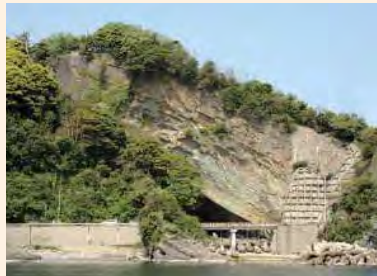
よみ 「黄泉の穴」(あの世の入口) いのめどうくつ 猪目洞窟遺跡