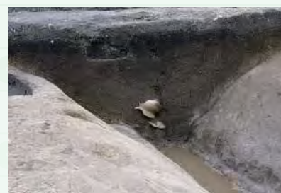
ムラを囲む大きな溝 (はば 3.3m・深さ 1.4m、下古志遺跡)