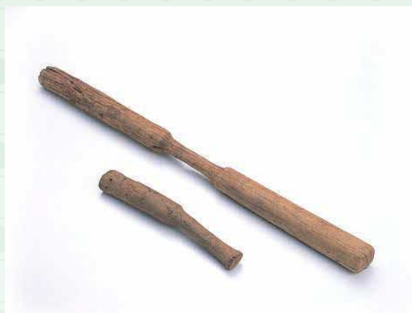
横ヅチとキネ (海上遺跡)