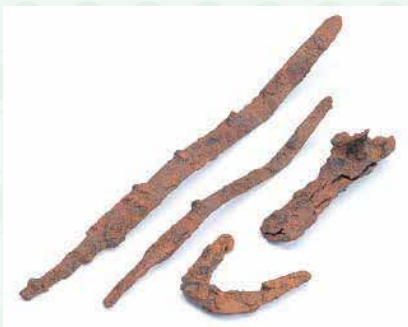
西谷 16 号墳（5世紀） の鉄剣と農具