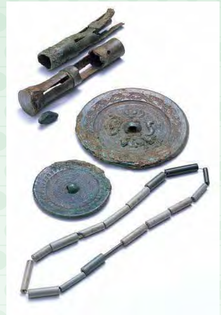
やまじ 山地古墳（4世紀）の副葬品 （市指定文化財）

出雲市内に残る古墳は、6世紀ごろのものが多いという特徴 とくちょう があります。なかでも、いまいちだいねんじ 今市大念寺古墳は出雲最大の前方後円墳で、よこあなしきせきしつ 横穴式石室に納められたいえがたせっかん 家形石棺は、日本一の大きさ ほこ を誇っています。