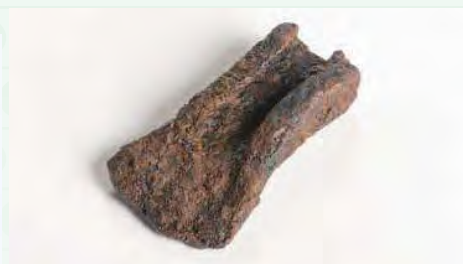
鉄のオノ (杉沢遺跡)