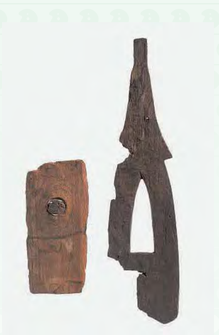
クワの先2種 (海上遺跡)