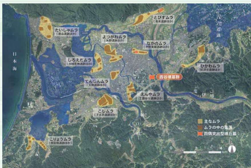
弥生時代の主なムラ