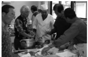
昨年の『男の料理教室』の様子

出雲科学アカデミーは、感動と驚きの空間である出雲科学館を拠点に、人文科学から自然科学まで幅広い分野の多彩な講師を招いて行う講座です。